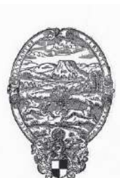
Écusson Du Fail